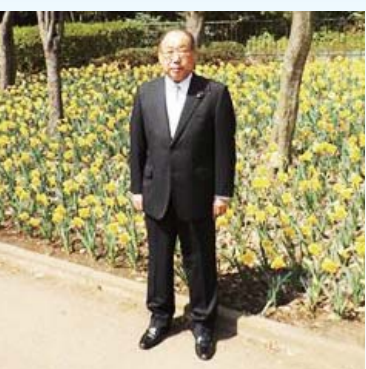
「スイセンまつり」にて