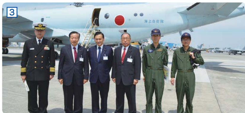
① 参議院外交防衛委員会で外相・防衛相に質問、②「産業技術総合研究所・つくばセンター」視察、③ 参議院外交防衛委員会で、海上自衛隊厚木航空基地を視察