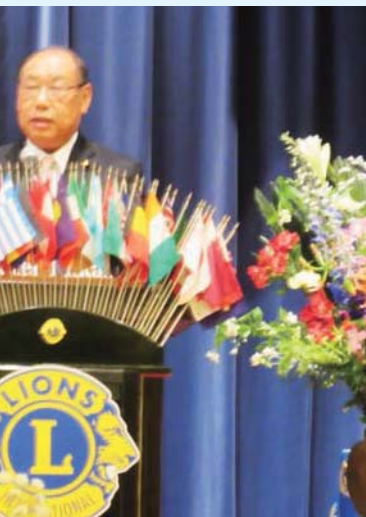
1045周年記念式典にて