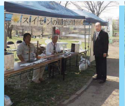
八千代市環境緑化公社の「