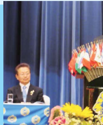
房総勝浦ライオンズクラブの