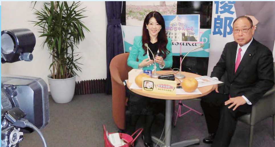
インターネット番組「突撃永田町!!」出演