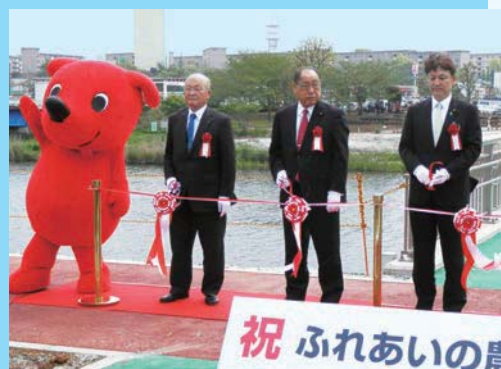
八千代市「ふれあいの農業の郷歩道橋」開通式にて