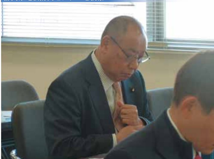
静岡県地震防災センターを視察