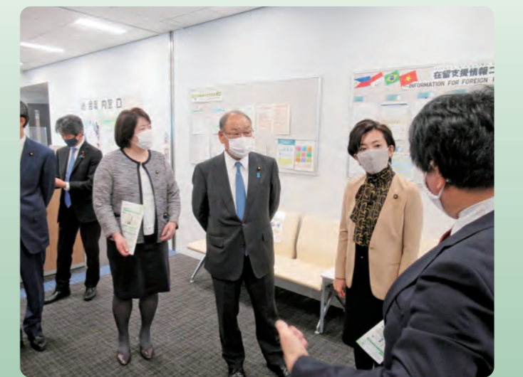
外国人在留支援センターを視察