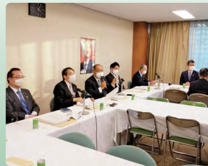
自治関係団体の政策懇談会