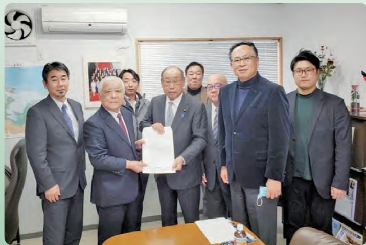
撮影時のみ、マスクを外しております

ほかにもコロナ対策にご尽力されている関係者の皆さま、特に医療関係者の皆さまにつきましては大変なご苦勞をされておりますことに深く感謝申し上げます。