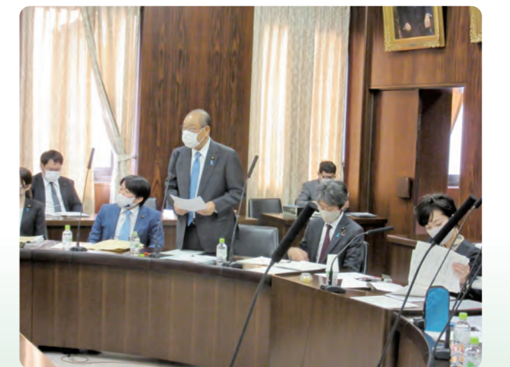
参議院法務委員会で質問